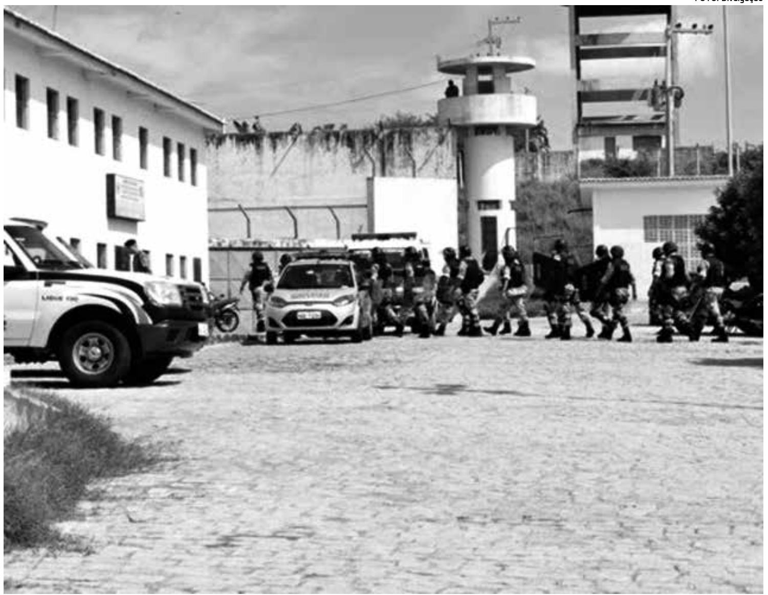
Policiais realizaram ontem uma operação de segurança na penitenciária, onde encontraram celulares, armas, crack e outros objetos

Os dados fazem parte da Taxa de Sobrevivência das Micro e Pequenas Empresas do Brasil, de outubro de 2011, realizada pelo Sebrae. Na semana passada, o Instituto Brasileiro de Geografia e Estatística (IBGE) divulgou os dados do Censo de Demografia das Empresas de 2010. De acordo com os números, quando toma-se todas as empresas do Estado, a taxa de sobrevivência da Paraíba também é superior que a média da região Nordeste. Na Paraíba, 77,1% das empresas sobrevivem aos dois primeiros anos de abertura. A média nordestina foi de 75,1%. No ranking da região, a Paraíba ficou em segundo lugar, perdendo apenas para Sergipe (77,2%).