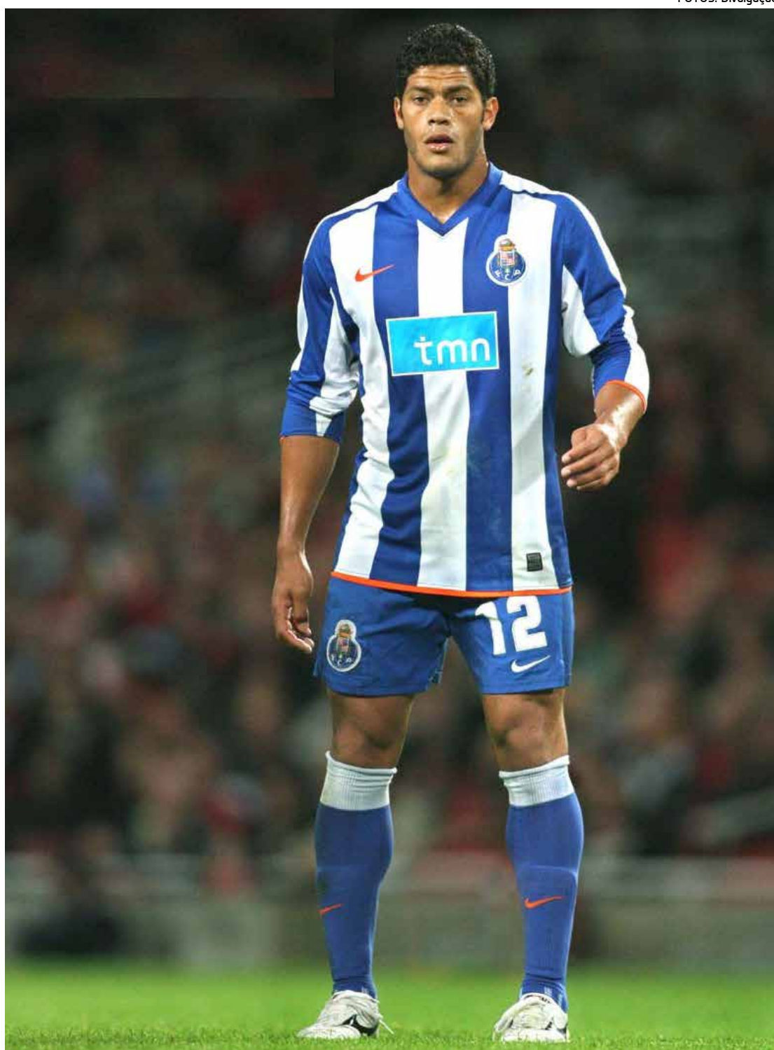
Hulk iniciou carreira no Vitória-BA, mas foi no Japão onde se transformou numa grande referência

reira profissional no Vitória, em 2004, e rumou para o Japão no ano seguinte. Na Terra do Sol Nascente, o at-