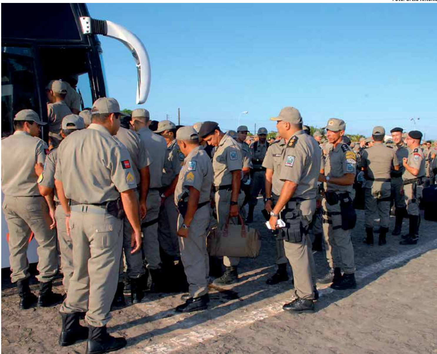
Policiais militares, junto a homens da Civil, PF, PRF, Bombeiros e Exército, estarão nas ruas para garantir a tranquilidade nas eleições

Os documentos darão uma análise geopolítica do ambiente de trabalho que será encontrado durante o pleito. Uma semana antes da votação também haverá a distribuição das escalas finais de trabalho. “Tudo isso faz parte de um conjunto de esforços para fazer uma ação o mais proativa possível”, frisou o comandante-geral, coronel Euler Chaves.