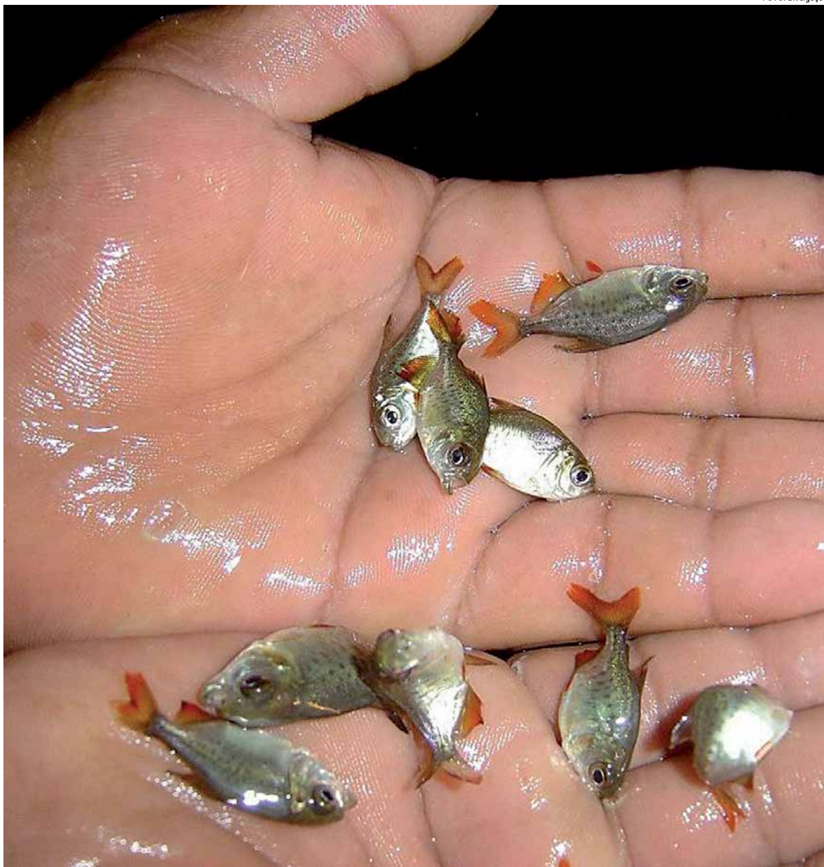
Alevinos produzidos pela Estação de Piscicultura de Itaporanga são distribuídos para pequenos produtores de pescado em várias regiões do Estado

Serão promovidos ainda curso junto às nutricionistas das prefeituras de João Pessoa e Cabedelo em parceria com o IFPB.