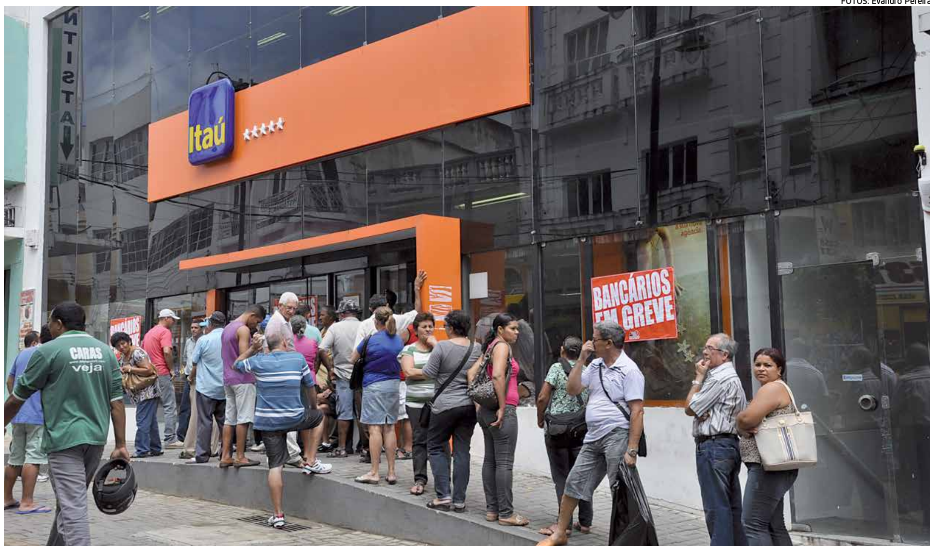
Durante uma hora bancários se postaram nas entradas das agências, retardando a abertura e chamando a atenção da população para as reivindicações da categoria

A atividade realizada ontem nas agências situadas na Rua Duque de Caxias, centro da capital, fez parte da mobi-