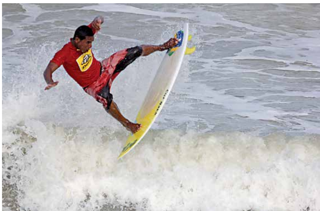
O paraibano numa de suas manobras radicais no Mar do Macaco, em Cabedelo, no último fim de semana