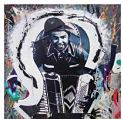
A coletiva reúne trabalhos de artistas que retrataram Luiz Gonzaga em xilogravura, pintura, fotografia etc