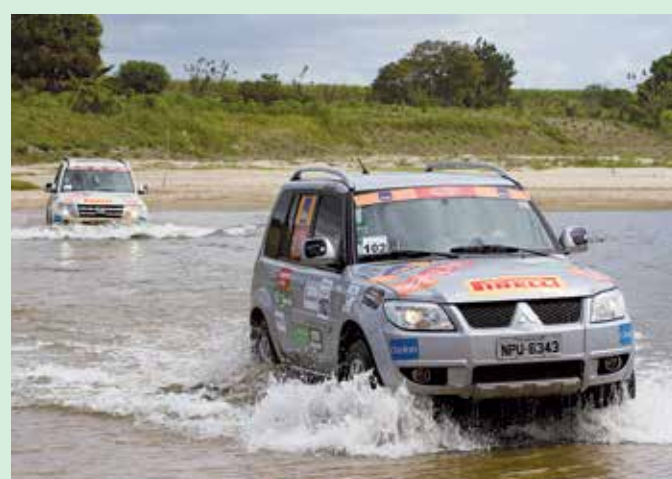
Muita aventura e solidariedade no Mitsubishi do Nordeste

Na categoria Graduados, destinada aos mais experientes, e Turismo, com experiência intermediária, as duplas