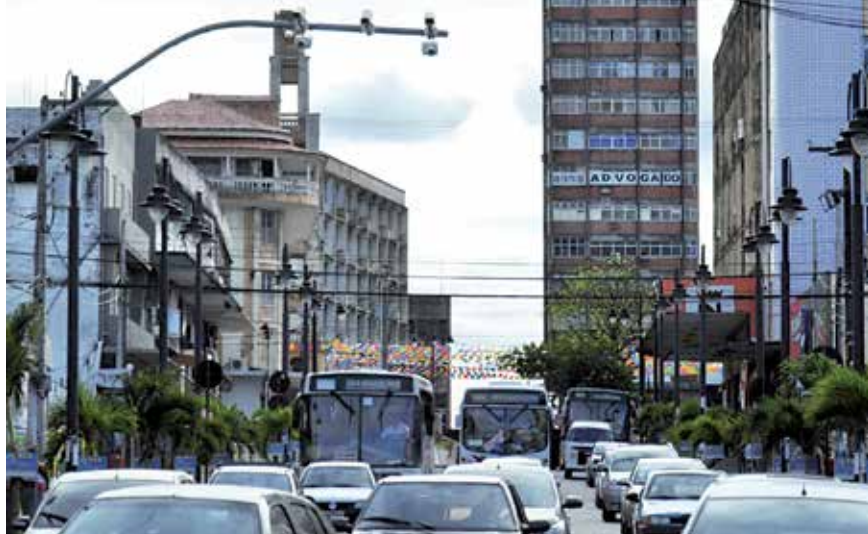
Ruas de JP serão monitoradas por 68 câmeras PÁGINA 14