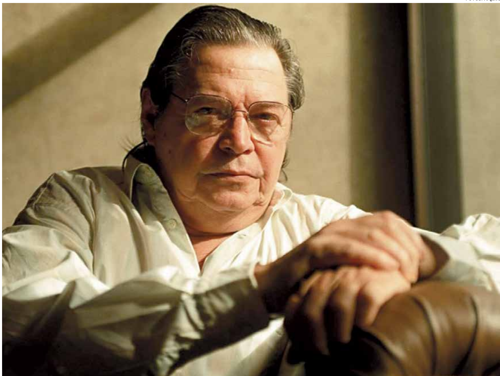
Tom Jobim aparece no livro com as músicas “Águas de Março” e “Corcovado”, em interpretações ao lado de Elis Regina e Frank Sinatra