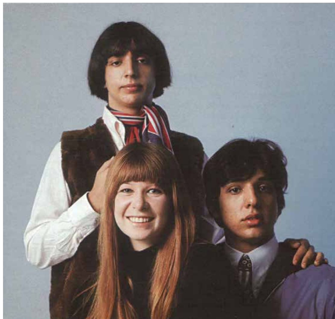
Os Mutantes estão entre os brasileiros que constam da obra de Robert Dimery