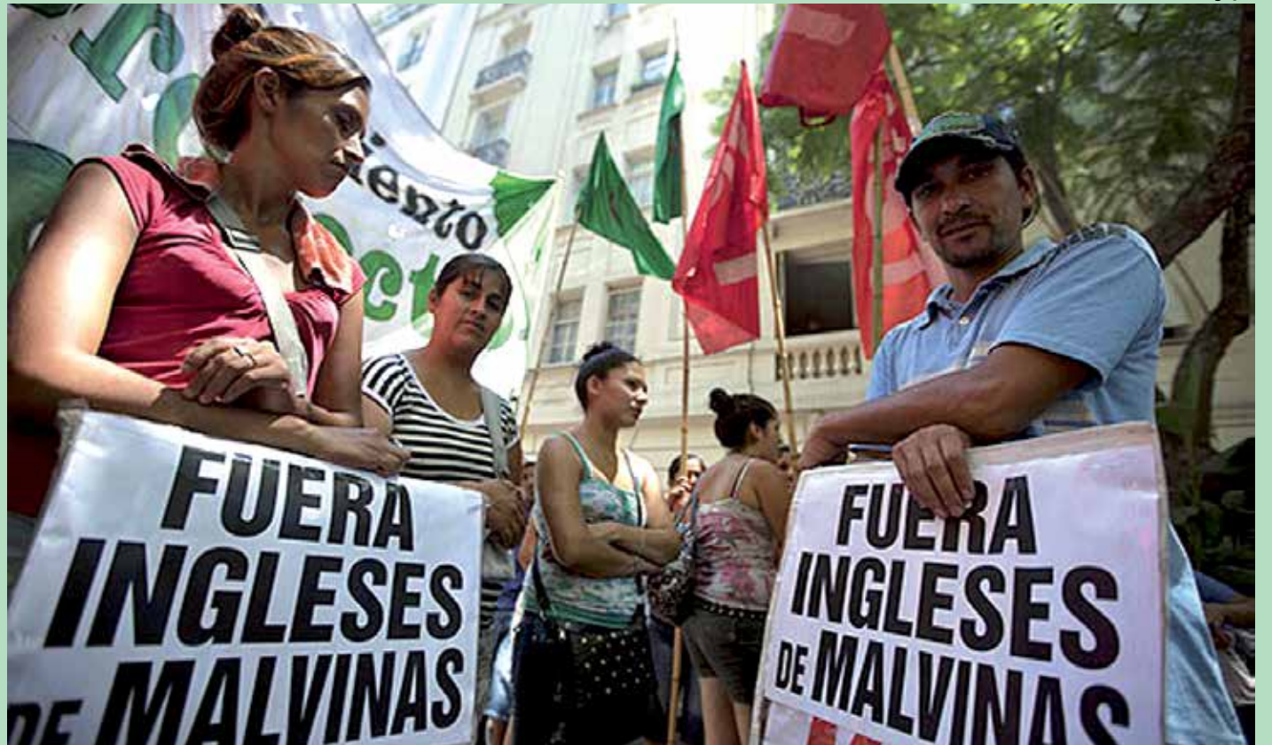
Manifestantes pedem a saída do Reino Unido das ilhas Malvinas durante a realização de protesto na Argentina, em janeiro deste ano

Na semana passada, Santos já tinha anunciado a possibilidade do início de diálogo entre o governo e as Farc, que possa conduzir a um eventual processo de paz.