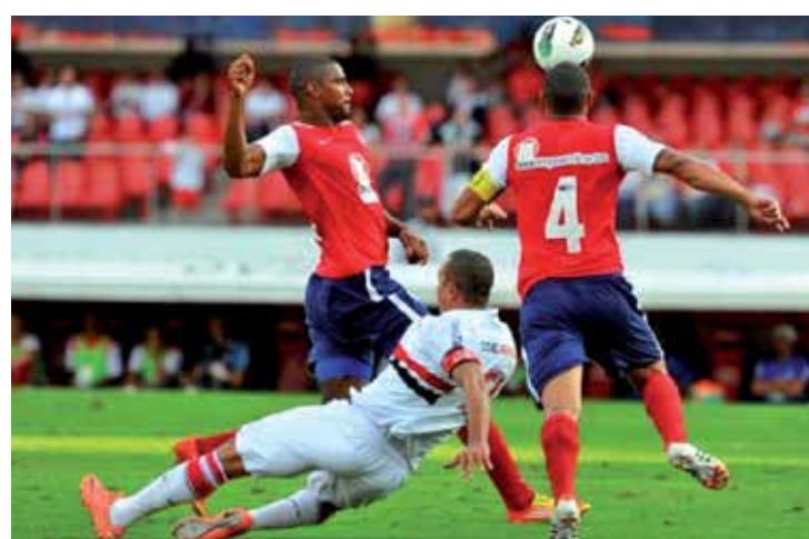
O São Paulo perdeu para o Bahia após falha do setor defensivo

causa de reclamação do fim de semana. Pelo menos sete dos dez jogos da rodada tiveram jogadores expulsos, o que gerou uma onda de revolta contra os árbitros. Os protestos mais veementes aconteceram no jogo entre Cruzeiro e Náutico, quando a confusão se postergou além do apito final.