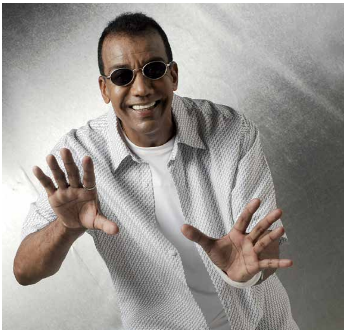
“Taj Mahal”, do carioca Jorge Benjor, também está entre as canções essenciais

O leitor vai encontrar de “O Sole mio”, de Caruso (da primeira década do século), a “Time to pretend”, do MGMT (2008). O leque é amplo: luminas da cultura pop, como Beyoncé e Britney, perfilam lado a lado com astros do universo indie, como Guillemots e Weezer.