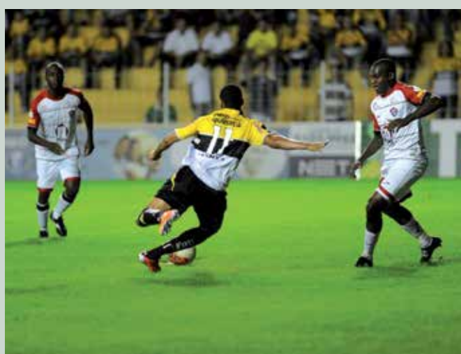
Apenas três pontos separam as duas equipes no Brasileirão