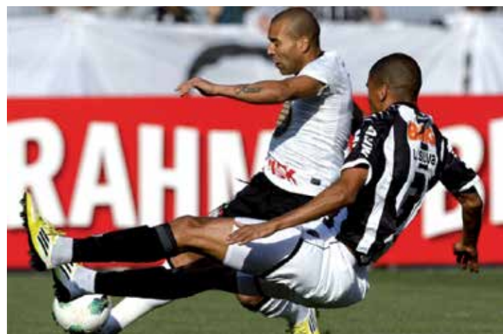
O Timão venceu o Atlético em jogo onde o juiz foi muito criticado