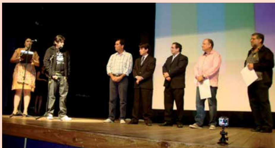
Premiação da sétima edição foi conferida nesse final de semana em Campina Grande