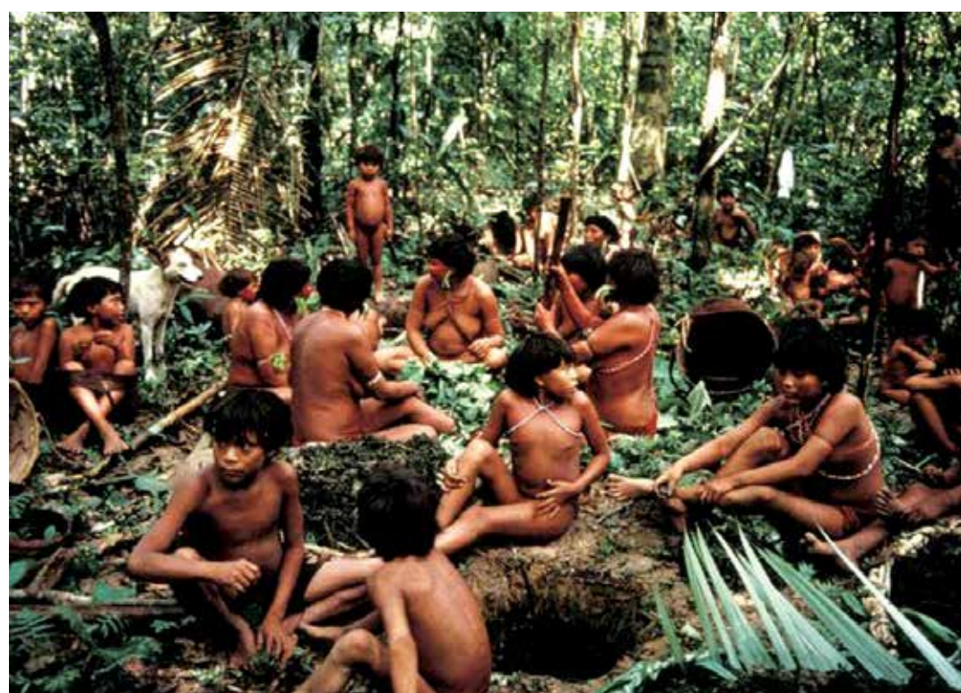
Ínomâmbis vivem em regiões da floresta amazônica; segundo relatos, massacre teria sido em julho

Após uma série de investigações sobre a denúncia de massacre envolvendo 80 indígenas yanomâmbis, o governo da Venezuela informou no último domingo que são improcedentes e falsas as informações. A ministra do Poder Popular para os Povos Indígenas, Nicia Maldonado, responsável pela apuração do caso, disse à emissora estatal de televisão venezuelana, VTV, que não há evidências sobre a suspeita.